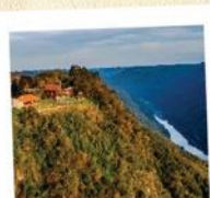
05 Mirante Pousada Vale das Antas