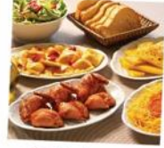
Restaurantes e Bares