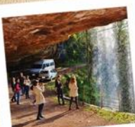
06 Gruta Nossa Sra. de Lourdes