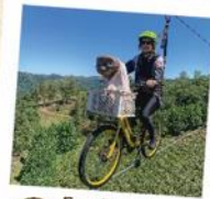
11 Eco Parque CIA Aventura