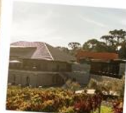
13 Vinícola Casacorba