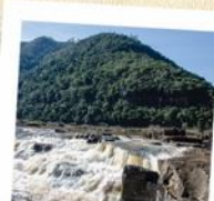
04 Trilha Cachoeirão