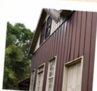
02 Museu Pelicelli