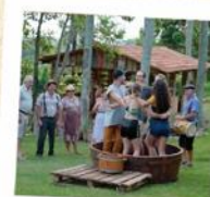
09 Vinícola De Bastiani