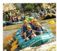
12 Rafting Rio das Antas