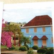
03 Centro Histórico