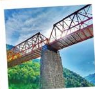
01 Ponte Nossa Senhora de Caravaggio