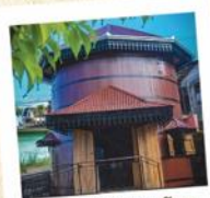
10 Informações Turísticas