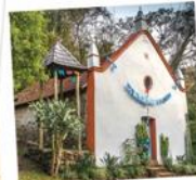
14 Trilha Capela São José do Rio da Prata