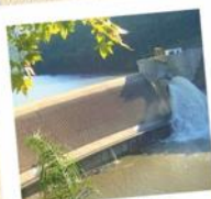
08 Mirante Usina Hidroelétrica Castro Alves